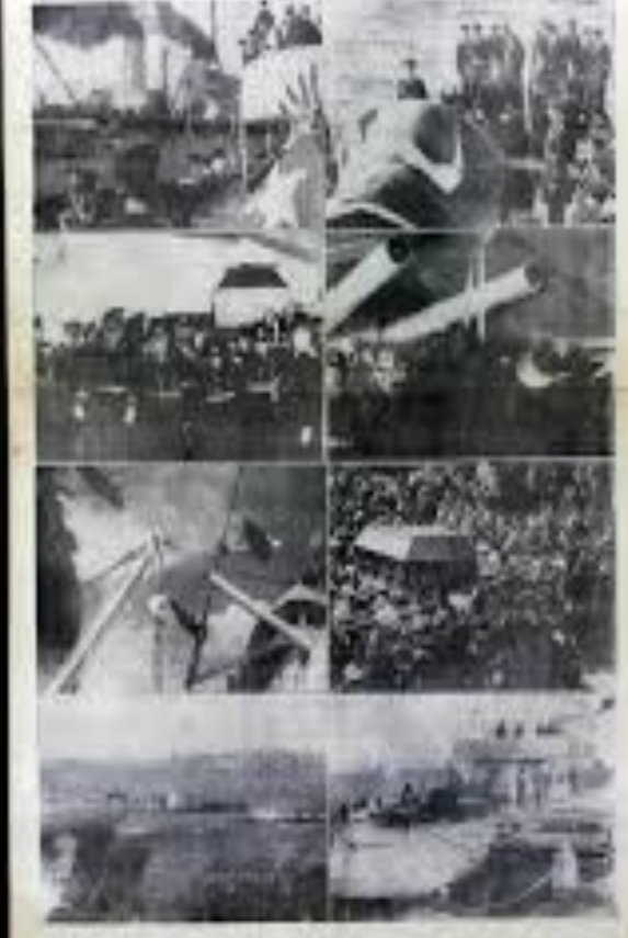
Fotoğraflar, Atatürk'ün Sarayburnunda ve Marmaracada toprağa verildiği günleri göstermektedir.