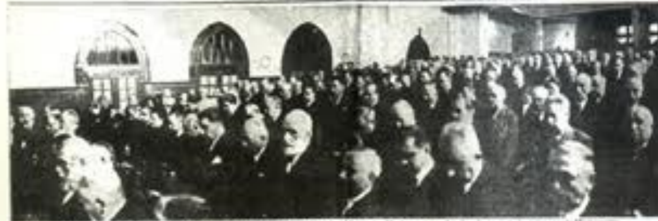
Gençlik dönü toplantısı...