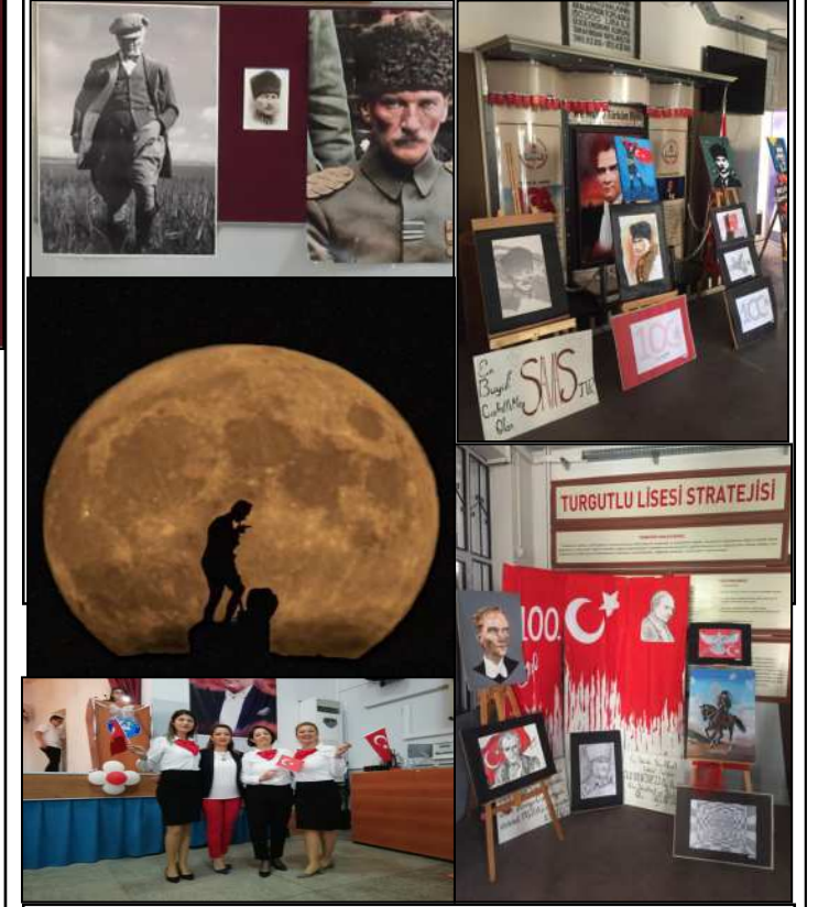
Cumhuriyetin 100. yılı kutlama programından

Cumhuriyet coşkusu Resim Kulübü'nün çalışmalarıyla okul panolarımızda yerini aldı. Bu anlamı büyük günde Cumhuriyetimizin kurucusu Büyük Önder Mustafa Kemal Atatürk'ü, kahraman silah arkadaşlarını, bu toprakları bizlere vatan yapmak için canlarını feda eden aziz şehitlerimizi ve kahraman gazilerimizi rahmet, şükran ve saygıyla anıyoruz. 29 Ekim Cumhuriyet Bayramımız kutlu olsun."