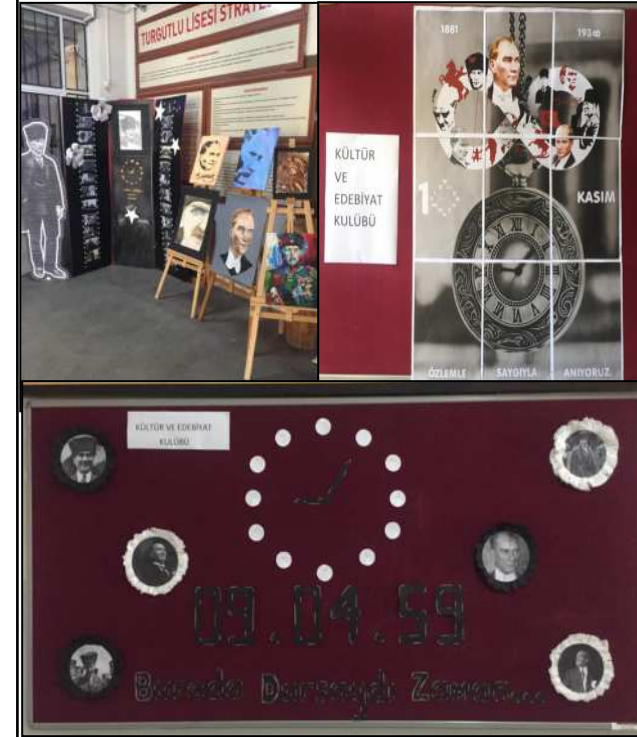
10 Kasım anma etkinliğimizden fotoğraflar

10 Kasım Ulu Önder Atatürk'ü ölümünün 85. yılında okulumuz Kültür ve Edebiyat Kulübü öğrencileri, panoları günün anlam ve önemiyle ilgili yazı, resim ve fotoğraflarla bu şanlı güne hazırladı.