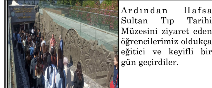
Ardından Hafsa Sultan Tıp Tarihi Müzesini ziyaret eden öğrencilerimiz oldukça eğitici ve keyifli bir gün geçirdiler.